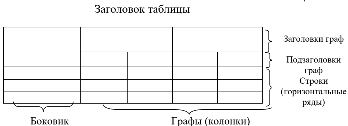
Рис. 1. Структура и вид таблицы

При переносе части таблицы на другую страницу слово «Таблица» и ее номер и заголовок указывают один раз над первой частью таблицы; над другими частями ставят слова «Продолжение табл.» и ее номер или «Окончание табл.» и ее номер.