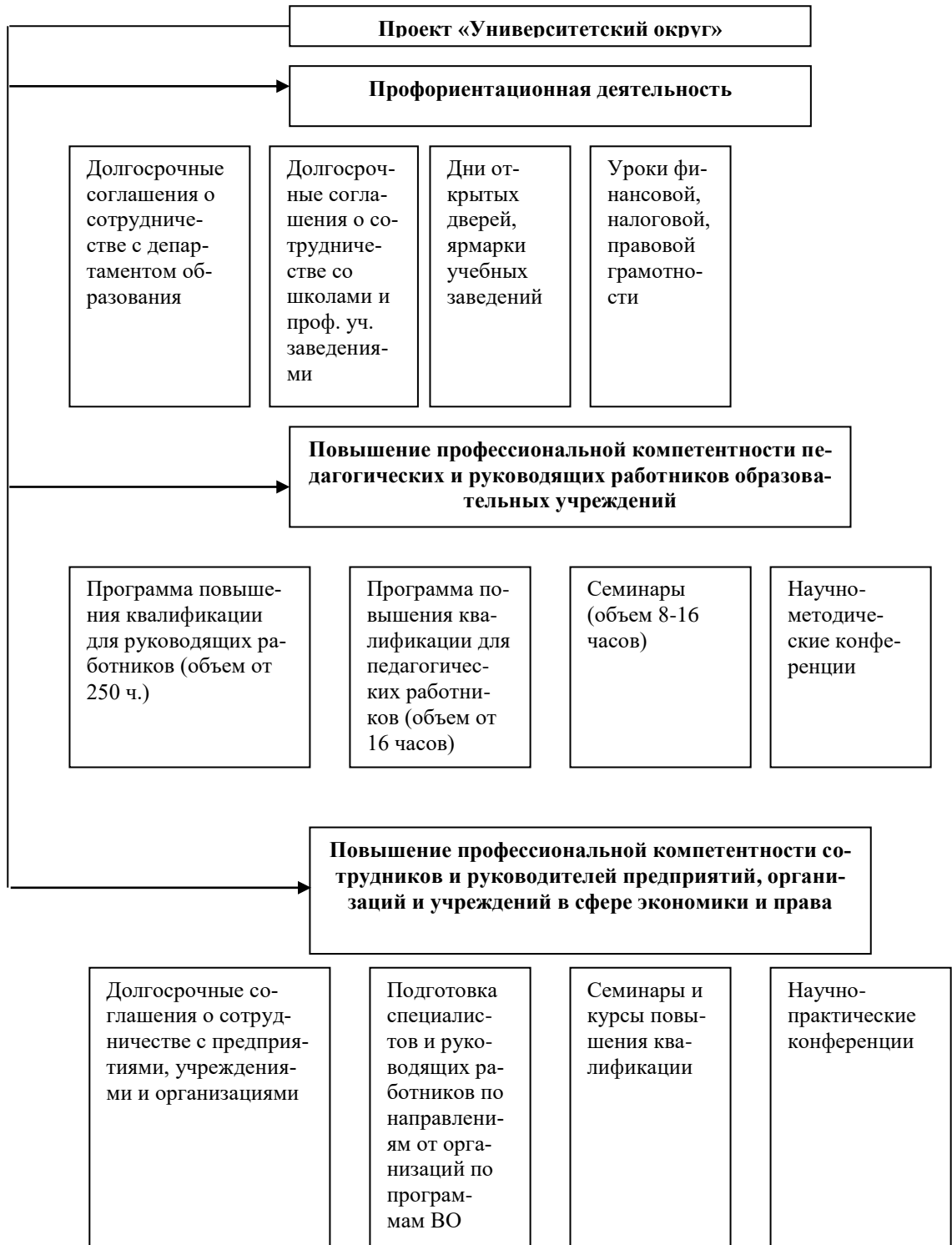
Рис. 2. Основные направления деятельности по проекту «Университетский округ»

С учетом ограничительных мер, введенных в связи с пандемией, в филиале «День открытых дверей» проходил в том числе и в дистанционном режиме. Конкурентные преимущества выпускников филиала БГУ определяются качеством подготовки, уровнем знаний, которые формируются на основе современных научных представлений, профессиональных компетенций и практических навыков обучающихся.