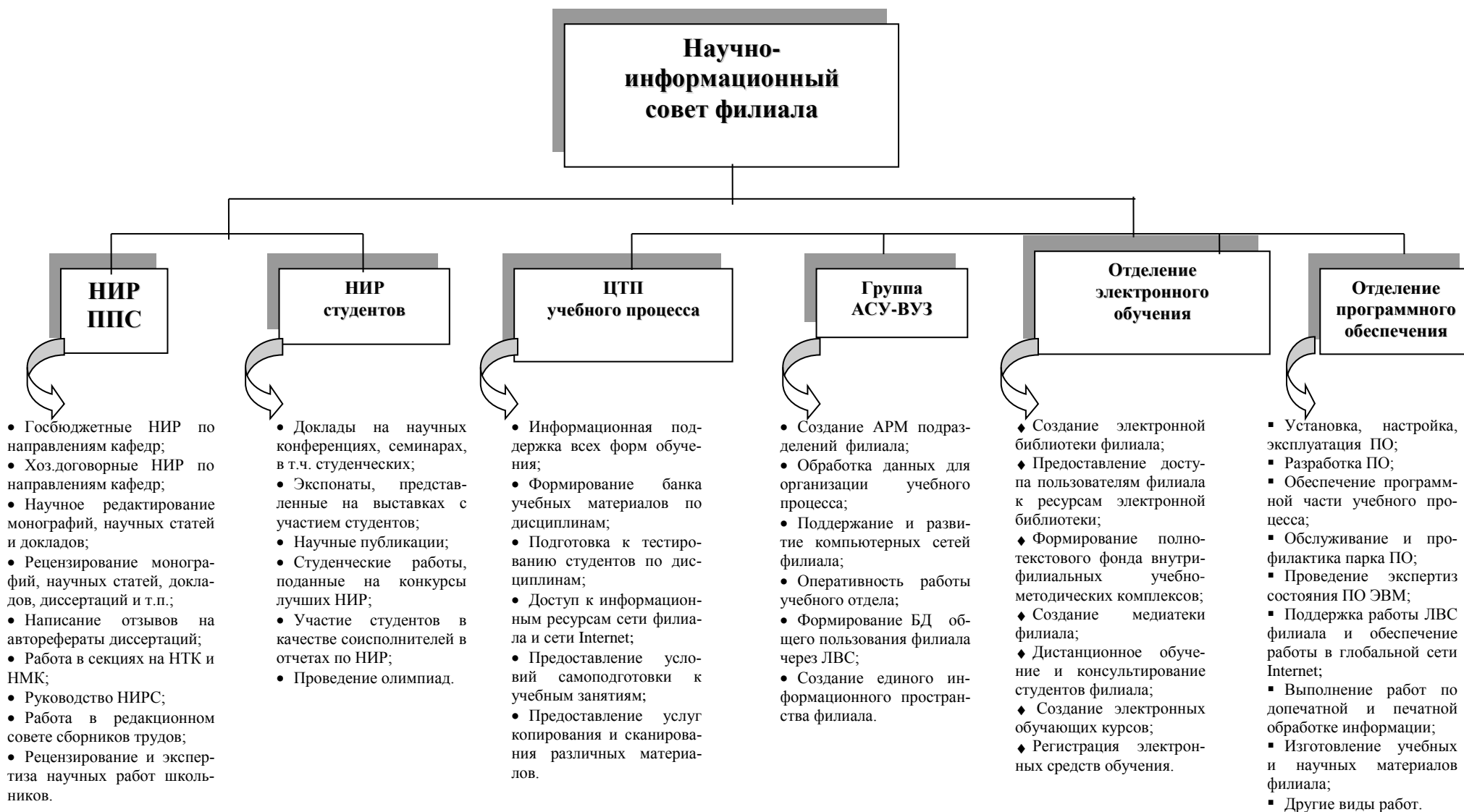
Рис. 4. Структура научно-информационного совета филиала