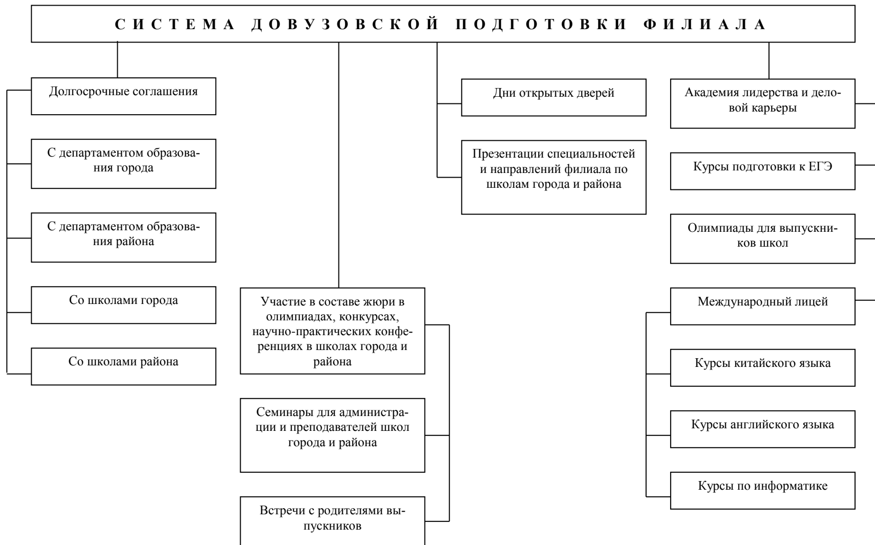
Рис. 2. Структура системы довузовской подготовки в филиале БГУЭП в г. Братске